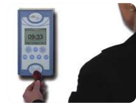
Buchung von Personalzeiten per RFID durch den Mitarbeiter Booking of staff time via RFID by the employer

Companies need to have flexible working times and a correct working time collection for a cost-effective business. This is ensured by electronic systems for time and attendance.