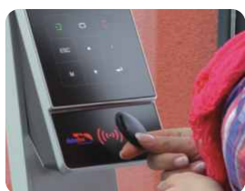
Buchung von Personalzeiten per RFID durch den Mitarbeiter Booking of staff time via RFID by the employer