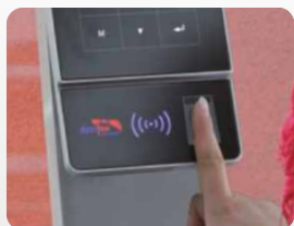
Personalzeitbuchungen mit optionalem Fingerprint. Staff time bookings with optional fingerprint.