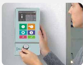
Individuelle Bedruckung der Front am EVO 4.3. Individual printing on the front EVO 4.3.