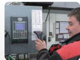
Betriebsdatenerfassung mit externem Barcode-Leser. Production data collection with external bar code reader.

For the control of operations, improvement of cost effectiveness, making accounts and so for ensuring a cost-effective production, companies need to have correct data from order times, machine times, downtime with reasons, process parameters, quality and more. It is guaranteed by electronic operating- and machine data collection.