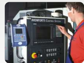
AE-MasterIV im Einsatz zur Maschinendatenerfassung. AE-MasterIV in use for machine data collection.