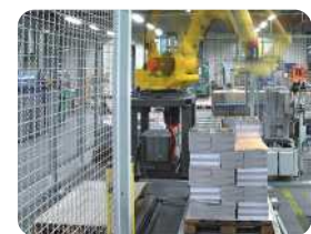
Integrierte Zutrittskontrolle zur Anwendung in der Produktion. Integrated access control for use in production.